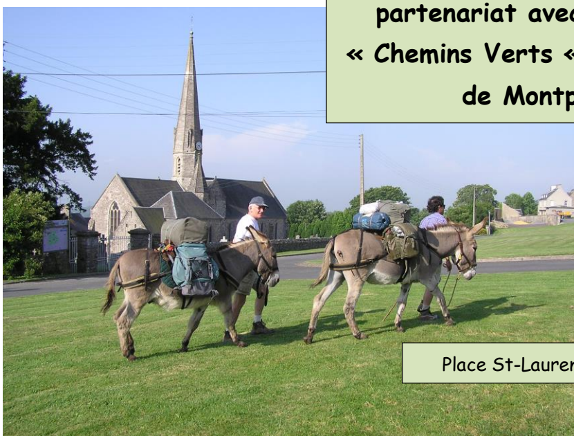
Place St-Laurent, devant l'église

Randonnée organisée en partenariat avec l'association « Chemins Verts » et la commune de Montpinchon